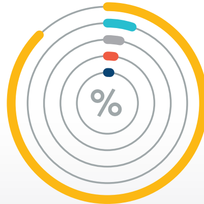
Carta 4.2: Perbelanjaan Kewangan mengikut Bidang Tumpuan, %