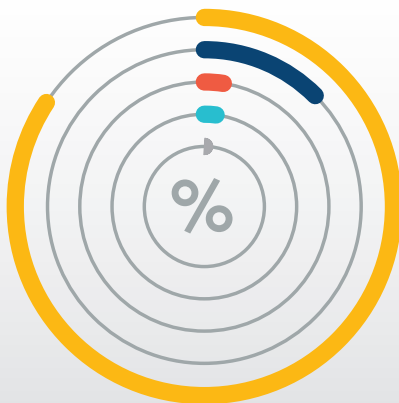
Carta 4.3: PKS yang Menerima Manfaat mengikut Bidang Tumpuan, %