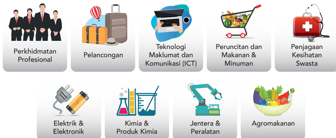
Carta 3.1: Subsektor Nexus Produktiviti

Sebanyak 43 inisiatif di peringkat sektor sedang dilaksanakan melalui sembilan Nexus Produktiviti. Pengenalan Nexus Produktiviti di peringkat sektor dan perusahaan, bertujuan bagi membolehkan sektor awam dan swasta untuk bekerjasama rapat dalam meningkatkan produktiviti dan daya saing