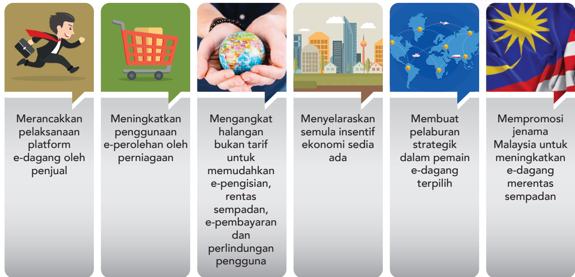
Carta 3.2: Bidang-bidang Teras yang dikenal pasti

11 program dan inisiatif yang berkaitan, meliputi enam bidang telah diberi keutamaan untuk jangka masa terdekat. Program ini dijalankan oleh lapan agensi sektor awam, iaitu SME Corp. Malaysia, Kementerian Kewangan, Suruhanjaya Komunikasi dan Multimedia Malaysia, Kementerian Perdagangan Dalam Negeri, Koperasi dan Kepenggunaan, Lembaga Pembangunan Pelaburan Malaysia (MIDA), Kementerian Perdagangan Antarabangsa dan Industri, Bank Negara Malaysia dan Perbadanan Pembangunan Perdagangan Luar Malaysia (MATRADE).