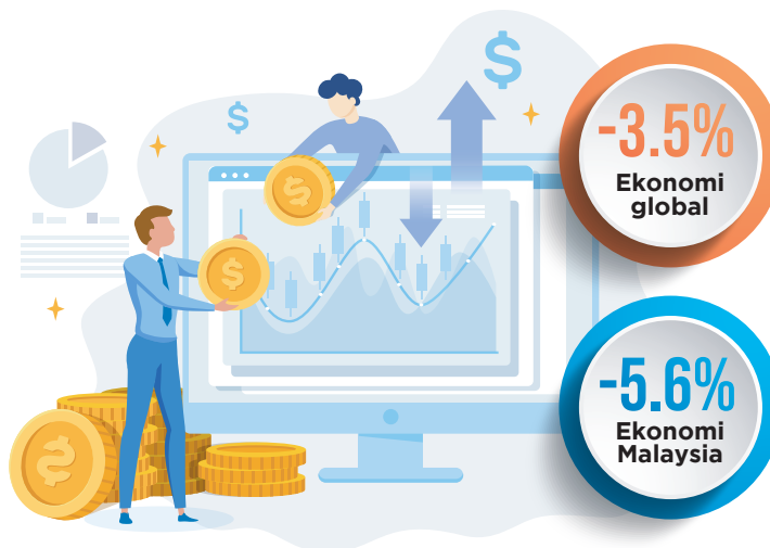
Carta 3.1: Pertumbuhan Tahunan KDNK bagi Tahun 2020